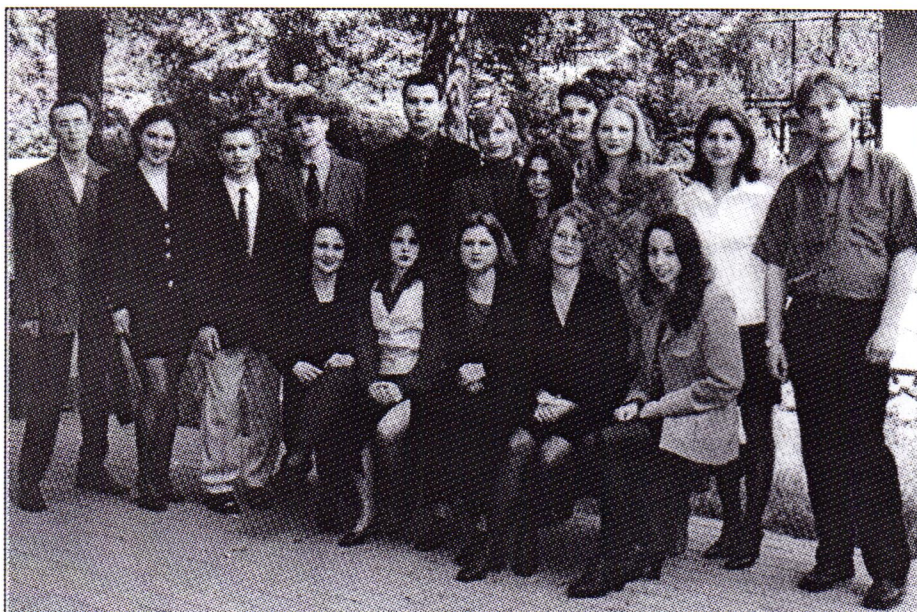
Второй выпуск экономического факультета - это: 81 менеджер и 15 социологов, среди них 23 диплома с отличием (см. стр. 8)

Блажен, кто имеет хороших друзей,- Что в мире подлунном милей и ценней?