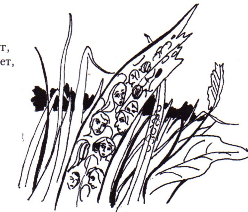
Рисунки И. Логачевой

А вокруг прогоревшая пойма Да полыни дурмящий звон, Хуторок на разводье и ...вон, Вон, где сом тобой в одури пойман.