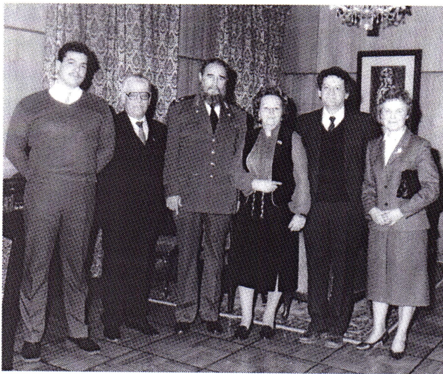
1986 г. - Международный дом Приемов: